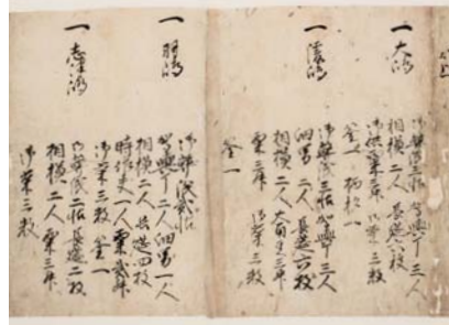
大井八幡宮御済納米銭役人文書(萩博物館蔵)

この記録には「相島」ではなく「優島」と記されています。「優」とは「かすかに見える」という意味です。六島のうちで相島が大井から一番遠くにあり、かすかに見えることから、このような漢字が当てられたのかもしれませんが、また、昔は藍染めの「藍」を栽培して栄えていた時代があり、その頃は「藍島」というように読み書きしていたともいわれています。