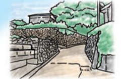
パッチワークの壁