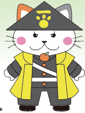
萩市マスコットキャラクター 忠義の猫「萩にゃん。」