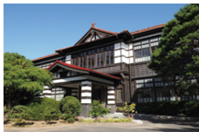
▲萩・明倫学舎本館

【萩・明倫学舎】長州藩の藩校だった「明倫館」の跡地に1935年に建設された旧明倫小学校の木造校舎を改修・整備した施設です。2017年3月に観光の拠点として本館・2号館が開館し、2022年3月に産業・ひとづくり・交流の拠点として新たに4号館がオープンしました。