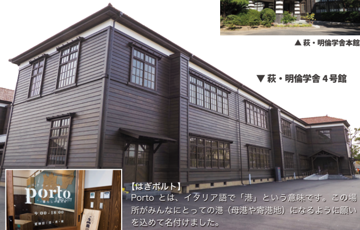
▼萩・明倫学舎4号館