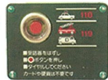
※緊急通報ボタンイメージ