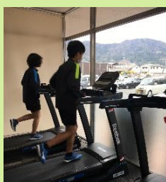
スタジオで楽しくトレーニング