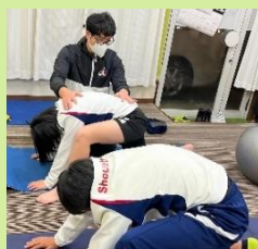
理学療法士による身体のケア

月会費：小3まで ¥2,000 小3～6年生 ¥2,500 中高生 ¥3,000