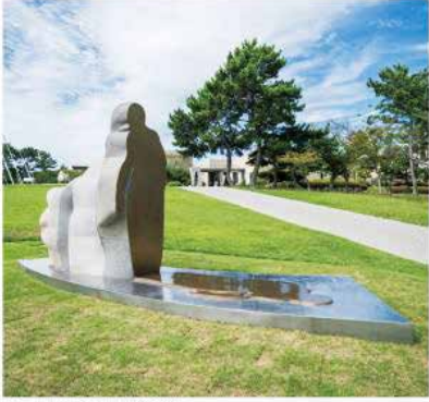
第29回UBEビエンナーレ「現代日本彫刻展」柳原義達賞受賞記念展 藤沢恵 melting border

問い合わせ先／宇部市文化振興課 ☎0836-34-8562 🌐https://ubebiennale.com