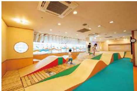
コロガルあそびのひゃっかてん会場の様子

問い合わせ先／山口情報芸術センター[YCAM] ☎083-901-2222 🌐 https://www.ycam.jp/