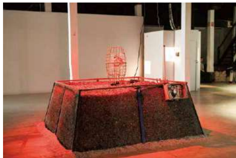
写真:Daniel James Grant 提供:アーティスト

問い合わせ先／山口情報芸術センター[YCAM] ☎083-901-2222 🌐 https://www.ycam.jp/