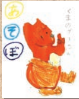
むつみ小1年 P・N くまのプーさんさん