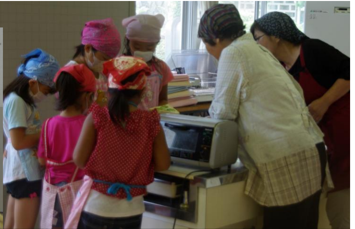
黙々とパンに具をのせる、のせる