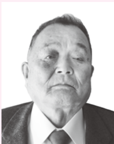
ずいほうたんこうしょう 瑞宝単光章

昭和31年に日展に初入選以来、長年にわたり作陶に取り組み、日本伝統工芸展などで受賞を重ねる。「伊羅保釉」の効果によって、萩焼の表現を押し広げた功績は顕著