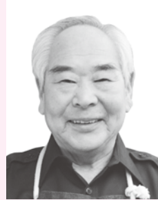
おうじゅほうしょう 黄綬褒章