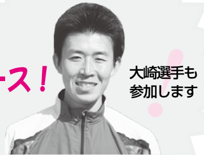
大崎選手も参加します

昨年からハーフマラソンのコースが萩城下町を一周するコースにかわり、今年は北海道から鹿児島県まで全国32都道府県から、過去最高の2,703人の申し込みがありました。