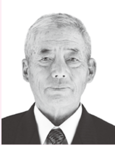
きよくじつそうこうしょう 旭日双光章