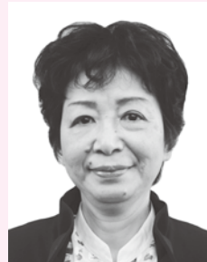
らんじゅほうしょう 藍綬褒章

手作業による「高級すだれ」の製造に長年従事。現在では、西日本唯一のすだれ職人として優れた技能を有し、業界の第一人者として認められている。