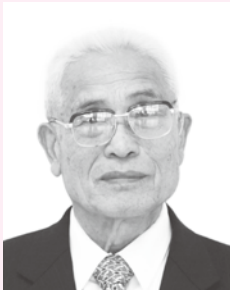
きよくじつそうこうしょう 旭日双光章

昭和54年に福栄村議会議員に当選以来、議長を2年務めるなど、7期27年にわたり、村勢発展に尽力