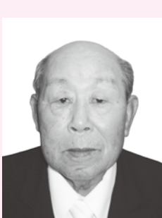
ずいほうたんこうしょう 瑞宝単光章

昭和27年に須佐町消防団に入団以来、約42年にわたり消防活動、団員の教育訓練、防火思想の普及に尽力