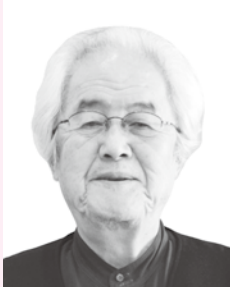
きよくじつそうこうしょう 旭日双光章

昭和45年にむつみ村議会議員に当選以来、議長を2年、副議長を2年務めるなど、8期32年にわたり村勢発展に尽力