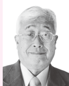
らんじゅほうしょう 藍綬褒章

昭和61年に家事調停員、平成3年に民事調停員、平成9年に参与員に任命されて以来、多数の調停・審判事件を円満・妥当な解決に導く。