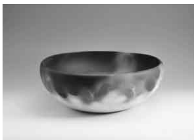
萩焼 岡田 裕 (炎彩花器)