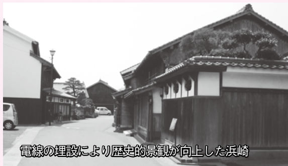
電線の埋設により歴史的景観が向上した浜崎

これは、電線類地中化やおふなぐら公園の整備、また住宅の修景に対する助成事業などが、以前とは見違えるまでの歴史的な雰囲気と調和した街並みを整備したことが評価されたものです。 これは、電線類地中化やおふなぐら公園の整備、また住宅の修景に対する助成事業などが、以前とは見違えるまでの歴史的な雰囲気と調和した街並みを整備したことが評価されたものです。