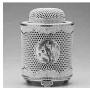
薩摩焼 十五代 沈 壽官 (薩摩籠目総透筒型香爐)