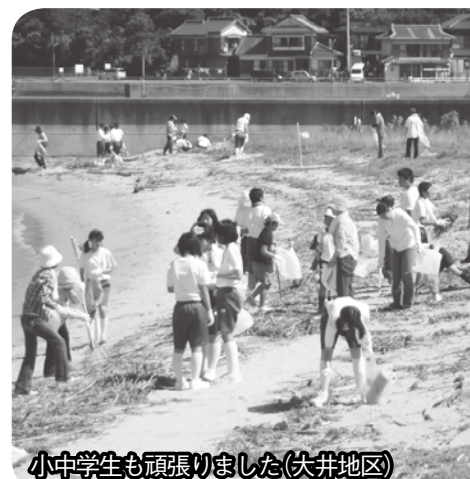
小中学生も頑張りました(大井地区)