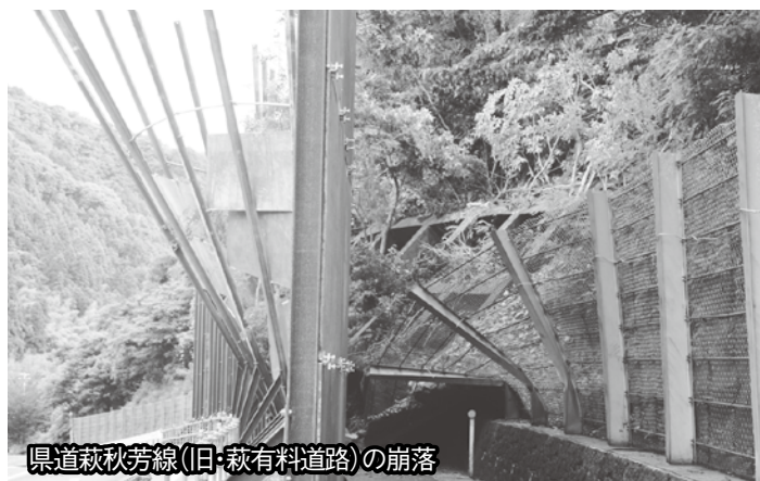
県道萩秋芳線(旧・萩有料道路)の崩落