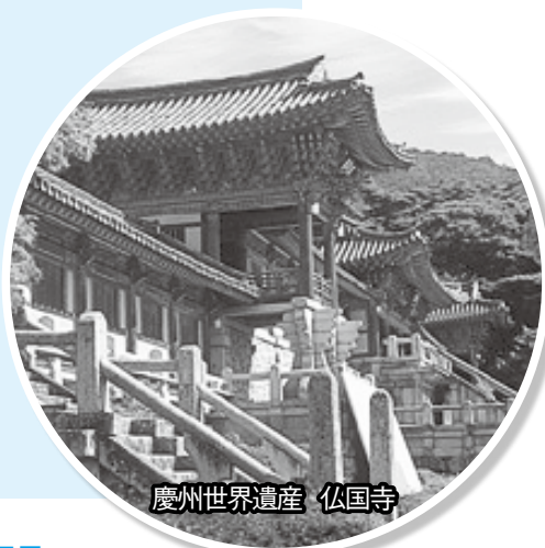
慶州世界遺産 仏国寺

慶州には、紀元前1世紀から10世紀に栄えた新羅王朝の都が置かれ、古墳や仏教関連の遺跡が多数点在。そのため、慶州は“屋根のない博物館”とも言われています。