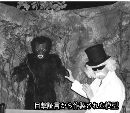
目撃証言から作製された模型

■臨時駐車場 博物館北側の職員駐車場を開放しています。普通自動車300円(市民の方は無料です)。