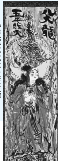
▶御八代龍王妃神尊々之図(紙本・彩色)倭絵