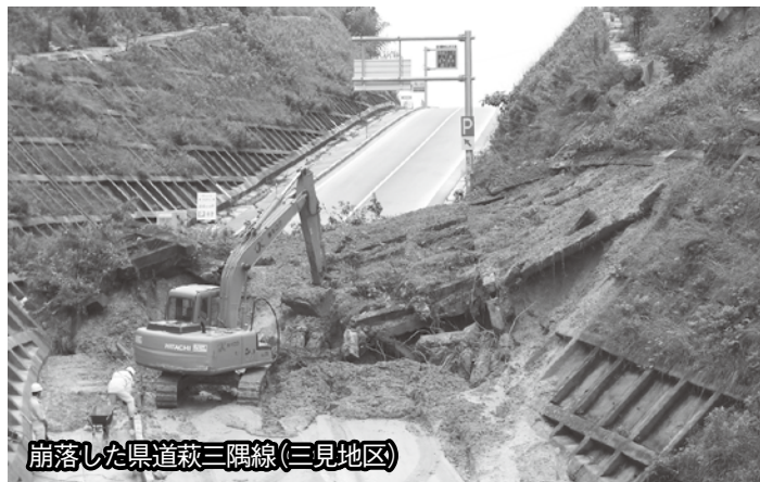
崩落した県道萩三隅線(三見地区)