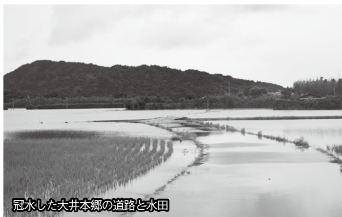
冠水した大井本郷の道路と水田