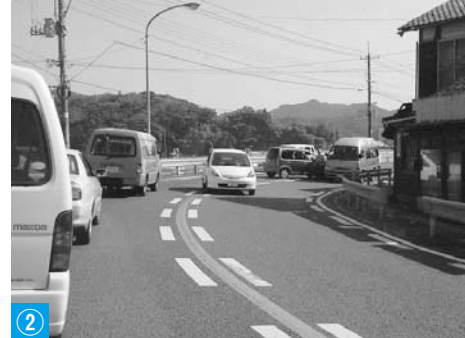
② 小畑地区R45の急カーブでの事故(8月)