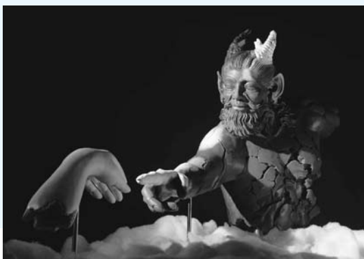
△龍人伝説《愛》