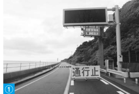
① 7月の豪雨で通行止めとなった国道191号 (阿武町)