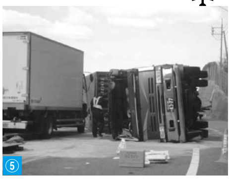
⑤ 越ヶ浜～大井間の事故