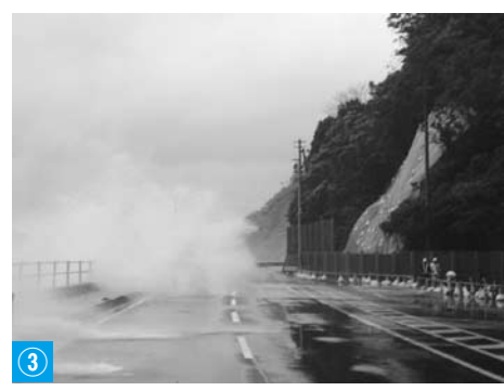
③ 越ヶ浜～大井間の越波(12月)