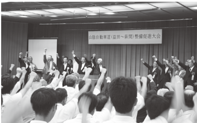
▲早期実現に向けてガンバロー！