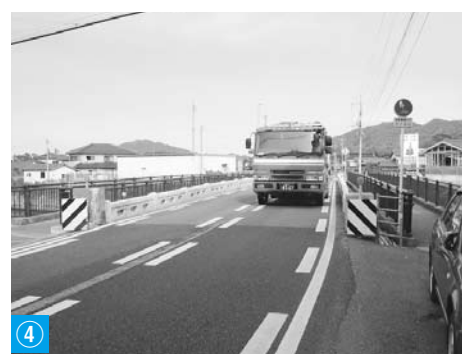
④ 大型車が離合できない大井橋