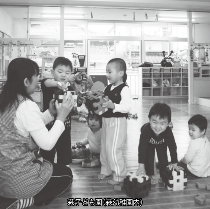
萩子ども園(萩幼稚園内)