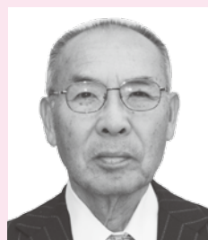
ずいほうたんこうしょう 瑞宝単光章