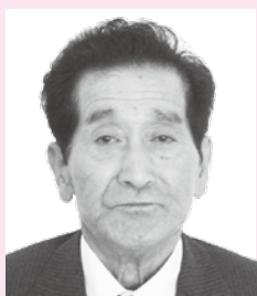
ずいほうそうこうしょう 瑞宝双光章

元旭村消防団長。昭和30年に佐々並村消防団に入団以来、約47年にわたり消防活動や団員への技術指導等に尽力