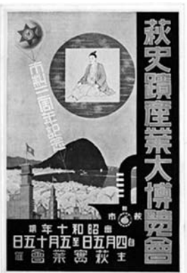
萩史蹟産業大博覧会 絵葉書 昭和10(1935)年

萩の史跡紹介と萩市経済の活性化を促すことを目的に博覧会が開催されました。萩町当時から史跡保存と顕彰の動きが一層活発化しました。