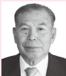
きよくじつそうこうしょう 旭日双光章