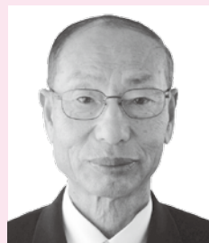
ずいほうそうこうしょう 瑞宝双光章

元田万川町議会議員。昭和54年に議員に当選以来、議長等の要職を歴任し、6期24年にわたり町勢の発展に寄与