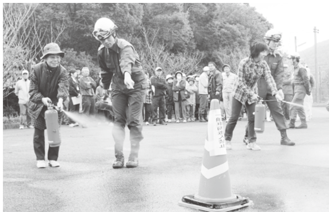
須佐地域総合防災訓練(11月20日) 住民が参加して体験型訓練