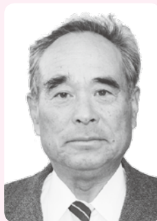
ずいほうしょうじゅしょう 瑞宝小綬章

昭和51年にむつみ村選挙管理委員会委員に就任。約28年にわたり選挙管理委員会の円滑な運営と発展に貢献。平成8年に委員長に就任