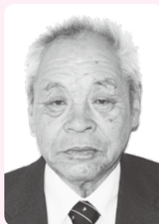
ずいほうたんこうしょう 瑞宝単光章

昭和44年から通算34年にわたり、住の江保育園保育士として直接保育に従事し、児童福祉の向上に努める