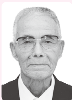
ずいほうたんこうしょう 瑞宝単光章

昭和38年に須佐町消防団に入団以来、約42年にわたり尽力。昭和55年の山林火災では的確な判断力で被害を最小限にとどめた