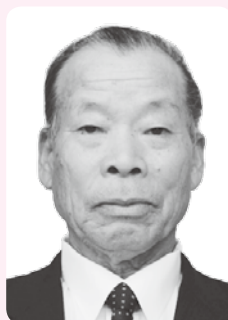
ずいほうたんこうしょう 瑞宝単光章

昭和36年に川上村消防団に入団以来、約48年にわたり尽力。昭和41年の大洪水では、水没地区住民を早急に避難させ、死傷者ゼロの実績