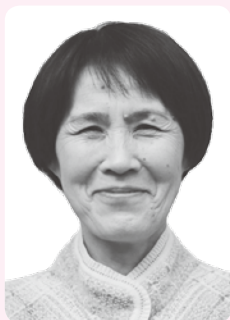
ずいほうたんこうしょう 瑞宝単光章

平成6年、徳山養護学校長として、多様な経験により力量を発揮。平成10年から萩商業高等学校長として、活力ある学校づくりに努める