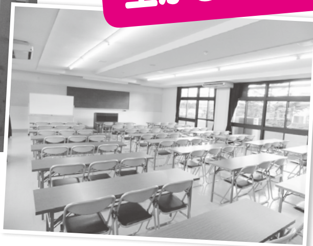
△約100人が入れる講堂

萩市が県から無償で譲渡を受けた萩青年の家（堀内）が、新たに「萩セミナーハウス」として11月11日にリニューアルオープンしました。