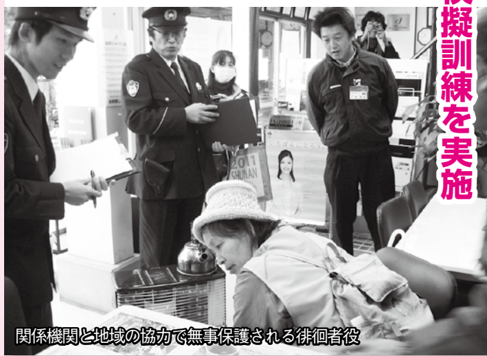
関係機関と地域の協力で無事保護される徘徊者役