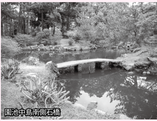
園池中島南側石橋