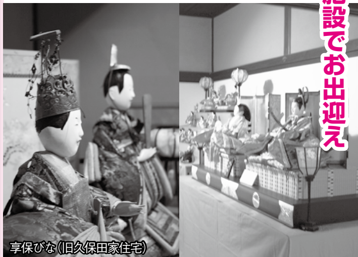
享びな(旧久保田家住宅)