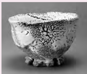
鬼萩花冠高台茶碗 銘 命の開花 平成15年(2003)

●「萩焼の人間国宝 三輪雪の鬼萩」 3月25日 全国の人間国宝の中で最高齢の陶芸家、三輪雪雪さん(椿東)は2月4日、102歳の誕生日を迎えました。