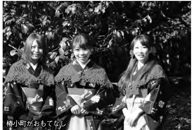
椿小町がおもてなし

椿の最盛期に合わせ、椿まつりが2月18日から始まりました。オープニングイベントでは、ステージで郷土芸能の舞が披露され、背景の椿の赤や緑と重なり、会場をさらに華やかにしていました。 会場内では椿見どころ案内人の無料ガイドや椿小町による会場案内等が期間中の土・日曜日に楽しめます。静寂な群生林のトンネルに入ると、来場者は、包まれるような独特の椿の世界に魅了されます。 笠山の椿は、今年は3月中旬ごろ開花のピークを迎える見込みです。