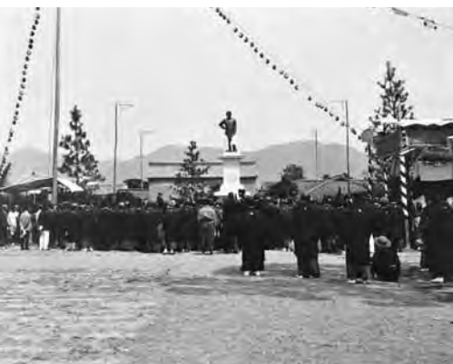
藤田伝三郎銅像除幕式