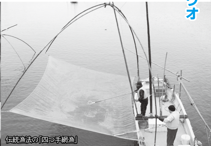
伝統漁法の「四つ手網漁」

シロウオは、ハゼ科の体長は5cmほどの半透明の小魚で、2月中旬頃から漁が始まります。昼4、5枚ほどの大きさの網を川に沈め、産卵のため海から遡るシロウオをすくいあげる、江戸時代から続く伝統漁法で、4月中旬まで行われます。