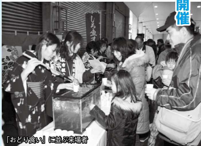
「おどり食い」に並ぶ来場者

なかでも一番の人気は、生きたまま酔じょうゆで食べる名物の「おどり食い」で、4000人分の無料サービスに来場者は長蛇の列を作り、シロウオの動き回る姿に驚きながらも、独特の食感やのどごしを楽しんでいました。