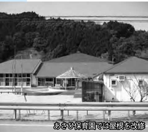
あさひ保育園では屋根を改修