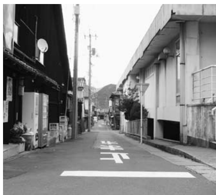
【漁人町筋】浜崎本町の三好酒店横から望む

が開校し、今回で最後の3年生が卒業しました。3月31日で萩商業、萩工業は閉校し、これまでの43年の歴史に幕を閉じます。