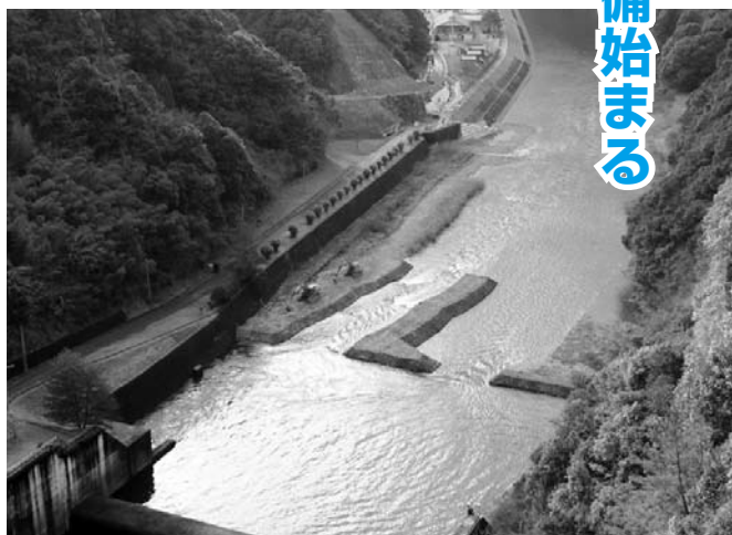
手前に阿武川ダム、正面に阿武川温泉

競技会場となる阿武川ダム下流では、2月から第1期工事として仮設コースの整備が始まりました。河川内の土砂を盛り上げたり岩を移動させたりして50mのスラロームコースを造り、流速や流量を調査します。その結果を元にして、これから順次会場を整備していきます。