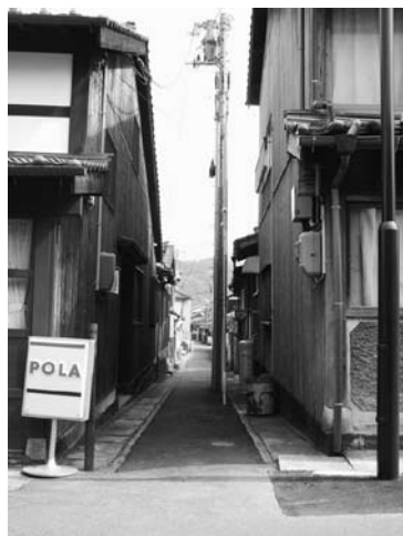
【船大工町筋】浜崎本町側から望む、幅約2mの小径