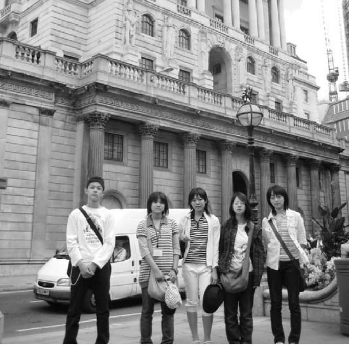
長州ファイブが視察したイングランド 銀行前で(今年の参加者)