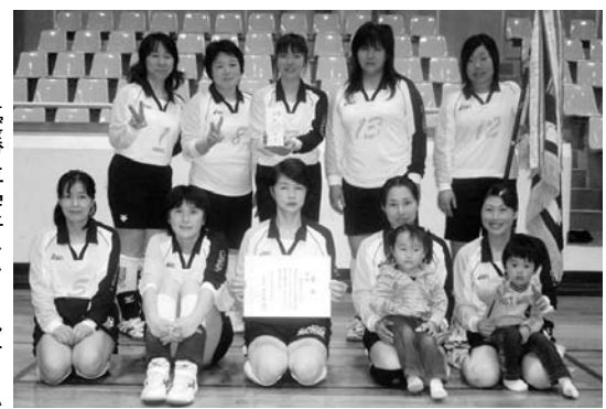
優勝 平安古ママさんチーム

4月27日、市民体育館で開催され、7チームが参加しました。 優勝 平安古ママさん 準優勝 無田ヶ原口 3位 つばき