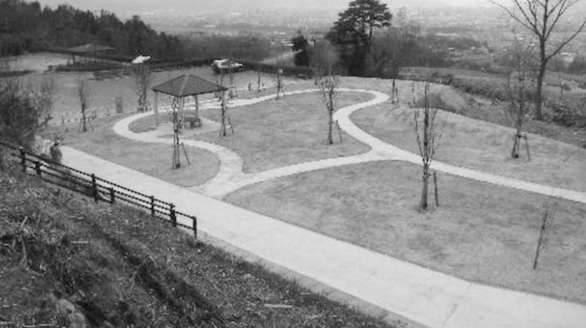
市街地や指月山などの景色が望めます