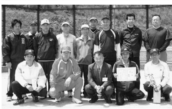
2部優勝 堀内チーム