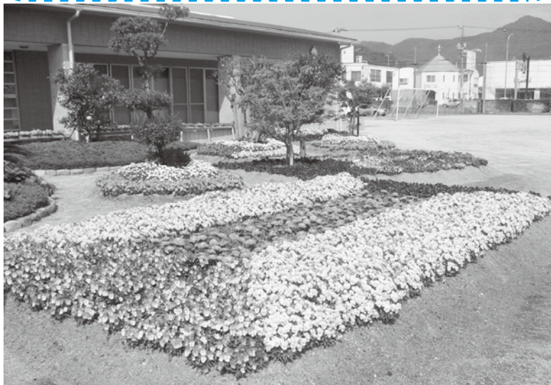
地域・職域団体の部金賞 萩公共サービス

4月7日から11日にかけて、萩市花と緑のまちづくり推進協議会により、受賞者が決まりました。