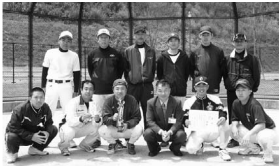
1部優勝 見島チーム