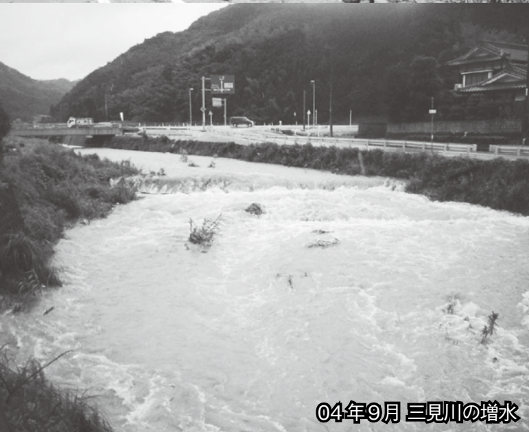
04年9月 三見川の増水