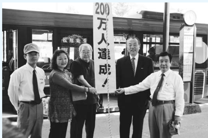
△200万人目は広島からの観光客

◎車内広告の募集 ご希望の方は商工課へお申し込みください ▷広告料 1か月4,200円