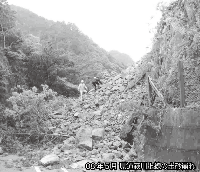
08年5月 県道萩川上線の土砂崩れ