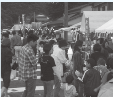
昨年のホタルまつり in やまだ