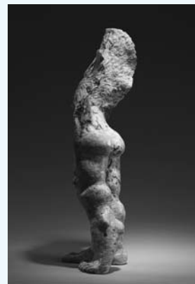
パク・チョンゲン デザインⅢ

6月28日（土）～7月21日（月）祝 旧久保田家住宅、旧田中別邸 ●観覧料：無料