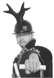
カブトムシの化身、かぶとぎむらい華舞闘侍と昆虫界へ!