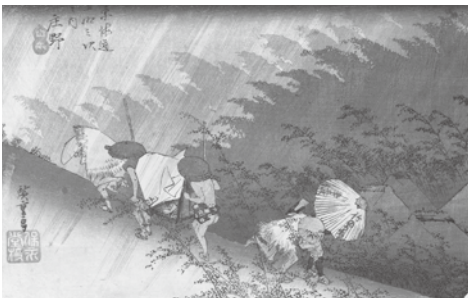
歌川広重「東海道五十三次之内 庄屋 白雨」横大判錦絵 天保4～5年(1833～1834)

代表作「東海道五十三次之内」をはじめ叙情あふれる風景版画155点を「江戸名所絵」「街道絵」「諸国名所絵」「名所江戸百景」の4セクションで紹介